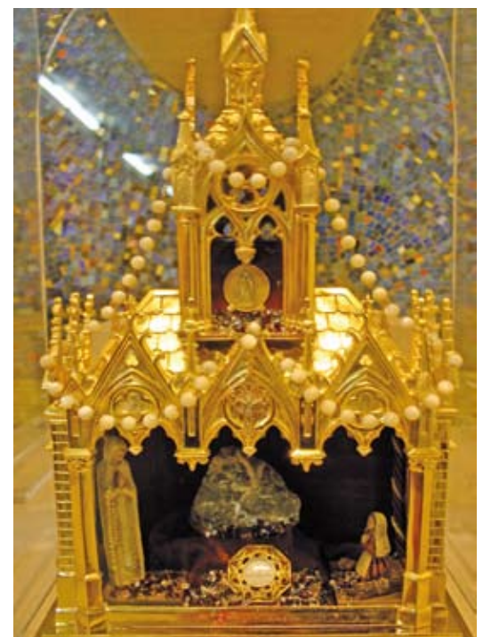
La Medaglia Miracolosa portata da Bernardetta

menti, ma è sempre è stata risistemata al suo posto.