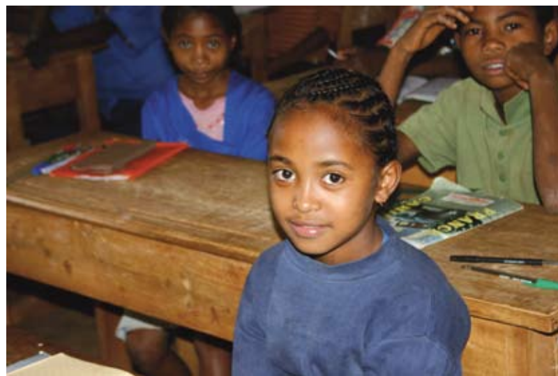
Jangany: il piazzale delle scuole e alcuni alunni