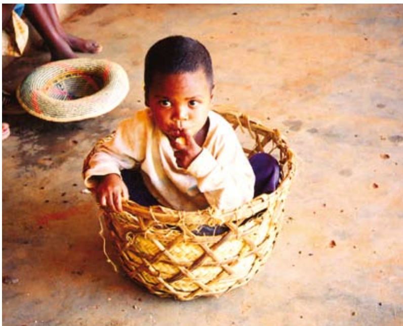
Bambino della Parrocchia di padre Grimaldi

La Civiltà Cattolica, nel numero del 16 maggio 2009, ha raccolto il grido di allarme di diverse organizzazioni umanitarie per il Madagascar. Il Paese sta affrontando una crisi umanitaria in rapido peggioramento, che non ha precedenti nella sua storia. L'emergenza è stata certificata dall'Onu e dalle principali agenzie umanitarie attraverso un appello del 7 aprile, secondo cui 2,5 milioni di malgasci hanno bisogno di assistenza internazionale e servono subito 35 milioni di dollari.