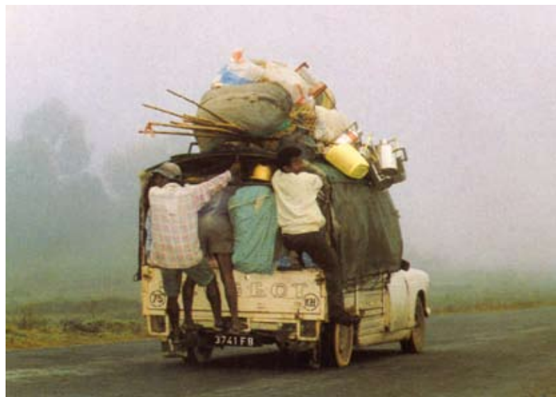
Madagascar: taxi brousse

arresto per “malversazione di fondi pubblici” nei confronti di Ravalomanana e sospendeva le trasmissioni di Radio Mada , Radio Chrétienne Fabazavana e Télé Mada legate al Presidente deposedo. “Reporter senza frontiere” ha denunciato censure e intimidazioni sugli organi di informazione, perché non diano sostegno alle manifestazioni contro Rajoelina. Affollate dimostrazioni pro-Ravalomanana sono avvenute anche ad Antsirabé, la terza città malgascia, a 160 chilometri a sud della capitale; erano coinvolti anche i dipendenti delle società del presidente deposedo, poiché le sue fabbriche sono state chiuse dal nuovo Governo. Dietro lo scontro politico sono evidenti anche gli interessi economici.