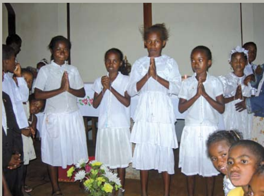
La vita dei missionari è molte volte meglio documentata dalle foto. Qui riportiamo alcune istantanee dell'amministrazione dei sacramenti del Battesimo e della Prima Comunione avvenute nel mese di aprile 2009 in alcune cristianità della brousse di Ranohira, curate da padre Reviglio