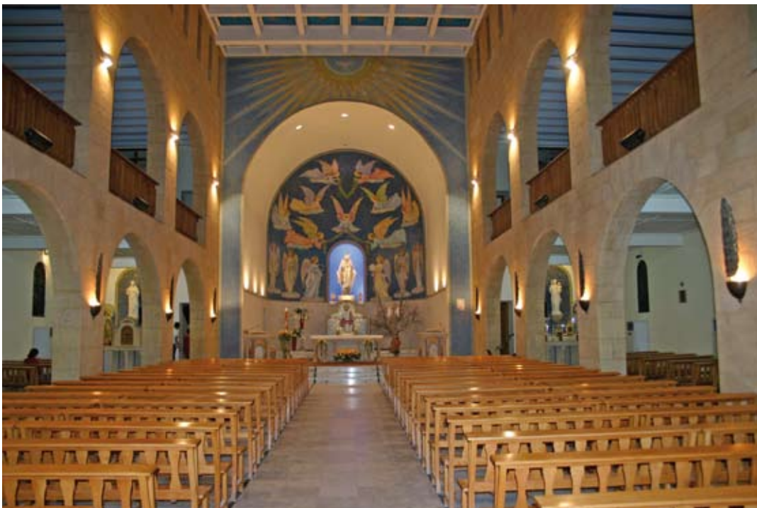
Beyrouth-Achrafié: il santuario della Medaglia Miracolosa

I missionari hanno trasformato il santuario da semplice luogo di devozione mariana a "santuario missionario": in esso infatti si svolge una perenne "missione nella città". Tutte le sere vi è una