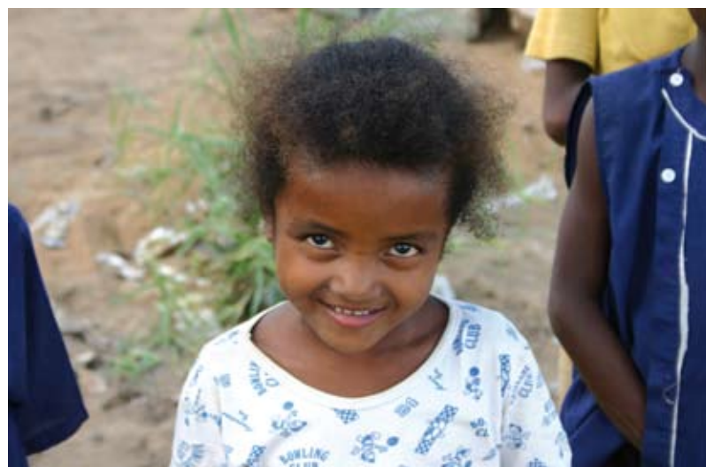
Una bambina della missione di Ihoso

Ihoso nell'ottobre scorso per mostrare il progetto e la sua validità. Noi a Ihoso siamo entusiasti della sua realizzazione, poiché verrebbe incontro ad una situazione veramente gravosa per i poveri, che non hanno le medicine.