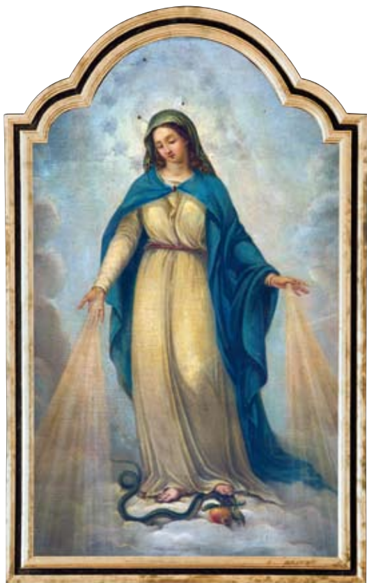
Immagine della Medaglia Miracolosa conservata nel Collegio Alberoni di Placenza

Nell'anno del 150° delle apparizioni della Madonna a santa Bernardette Soubirous si sono recati a Lourdes circa 9 milioni di pellegrini. I santuari di Lourdes non avevano mai visto un simile afflusso di persone. Anche il papa Benedetto XVI si è fatto pellegrino nel settembre del 2008 e in tale occasione ha lasciato un ricco magistero di cui raccogliamo qualche tratto.